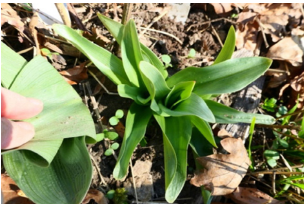
Abb. 18: Nr. 6 links mit breiten Blättern, Nr. 34, Nr. 15 Mitte mit 7 Blättern, Nr. 35; 04.04.2025

Im Boden des Trios zeigte sich in etwa 5 cm Tiefe, dass die Triebe sehr nah stehen (Abb. 19). An der Basis waren bei Nr. 34 rechts und bei Nr. 35 vorne die spitzen, weissen Erneuerungstrieb für 2026 zu erkennen. Da ich mich nicht getraute weiter zu graben, weiss ich nicht, wie viele Wurzelknollen es hatte.