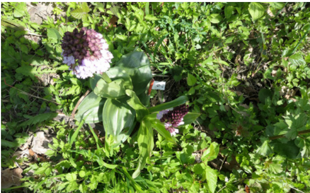
Abb. 5: Rosette Nr. 6 (links) eine alte, starke Pflanze und Nr. 15 (rechts) mit drei Rosetten; 20.03.2025