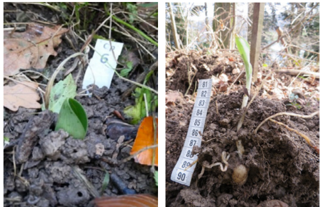
Abb. 9: Jährliche Erneuerung von Orchis mascula aus Reinhard et al. (1991, S. 72)