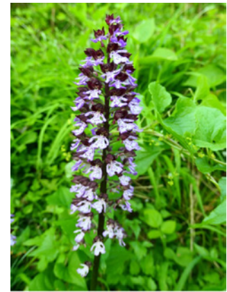
Abb. 16/17: Ähnliche Blüten bei Nr. 21 (Mitte) und Nr. 20 (rechts); 30.04.2025