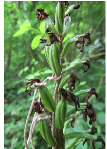
Abb. 14: Fruchtbildung, z.T. manuelle Bestäubung, wo ein Faden ist, spontane Befruchtung und unbefruchtete, schlanke Fruchtknoten; 02.07.2021

Es dauert mehrere Jahre bis nach der Keimung des winzigen Samens mit Hilfe von Mykorrhiza die ersten grünen Blätter erscheinen und dann nochmals 3-5 Jahre bis die ersten Blütenstände gebildet werden. Der Vorteil: es können sich mehrere genetisch unterschiedliche Pflanzen gleichzeitig entwickeln. So blühten Nr. 14, 15, 17 und 26 im Jahr 2024 erstmals (in Tabelle rosa), und ebenso Nr. 16, 28 und 30 im Jahr 2025 (in Tabelle hellblau). Die Blüten der einzelnen Pflanzen können sich in Form und Farbe erheblich unterscheiden (Nr. 6 auf Abb. 7, Nr. 15 auf Abb. 8), auch wenn sie in der Nähe wachsen.