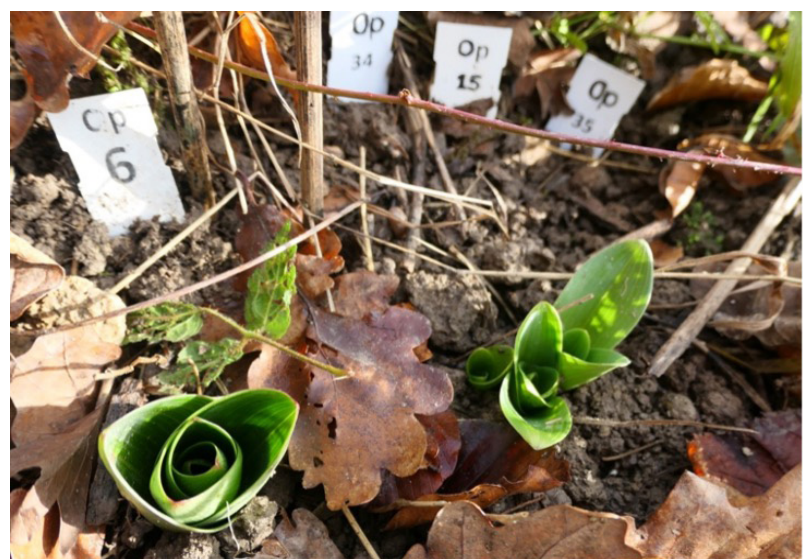
Abb. 20: Rosetten Nr. 6 links, Nr. 34 klein, Nr. 15 und Nr. 35 grösser; 20.12.2025.

Ende Dezember 2025 werden schon die neuen Triebe für 2026 sichtbar (Abb. 20). Nr. 6 links wird 2026 sicher blühen. Aber welche der drei anderen Rosetten wird einen Blütenstand bilden? Nr. 34 ist deutlich kleiner.