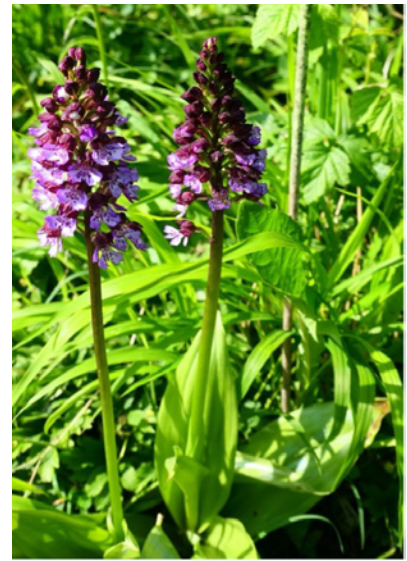
Abb. 2: links Nr. 1, dahinter rechts Nr. 2 und die neue Pflanze Nr. 31; 13.04.2024