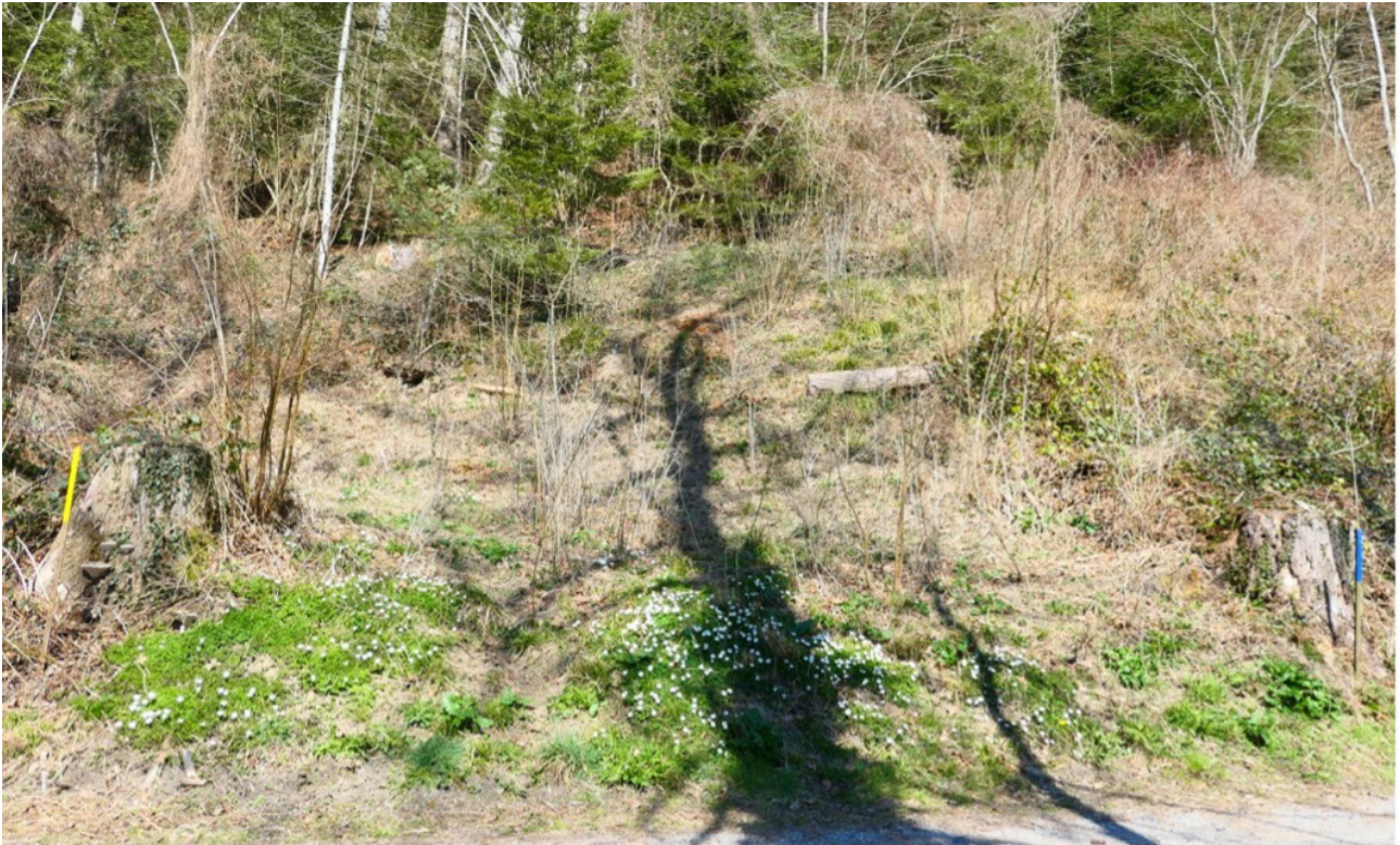
Abb. 21: Übersicht zum Standort 47 vom Waldweg aus, zwischen gelbem und blauem Pfahl, ohne Bäume; 20. 3. 25