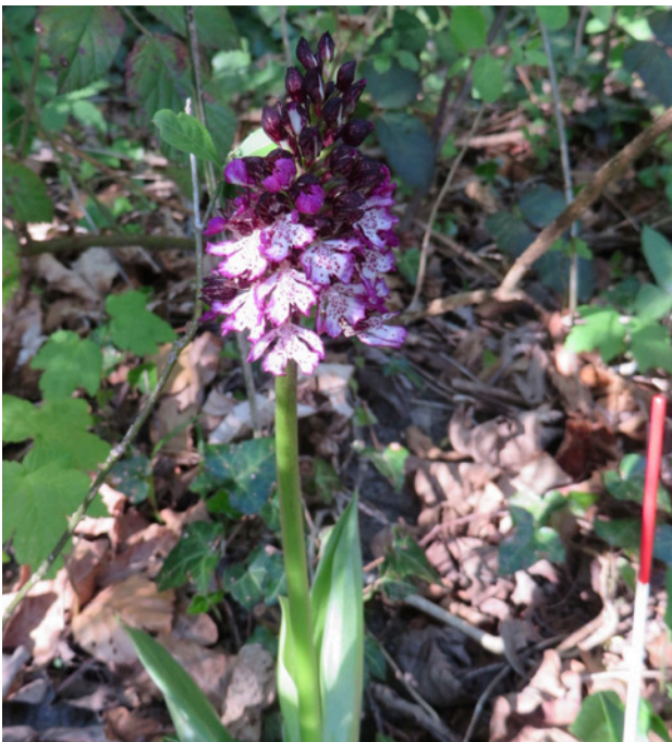
Abb. 22: Blütenstand Nr. 3, vor der vegetativen Spaltung 2024; 21.04.2022