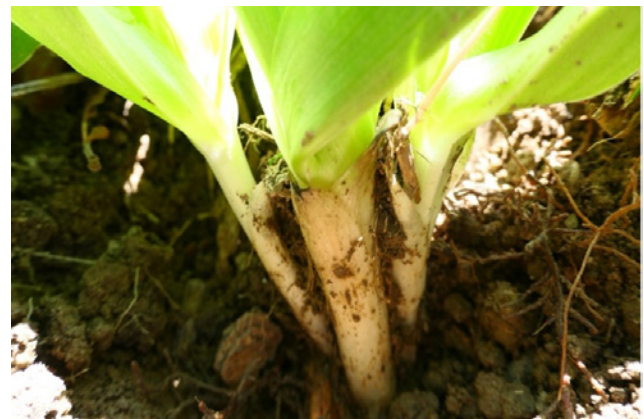
Abb. 19: Nr. 15, starker Spross in der Mitte, Nr. 34 links und Nr. 35 rechts durch vegetative Vermehrung entstanden; 04.04.2025

Ende Dezember 2025 werden schon die neuen Triebe für 2026 sichtbar (Abb. 20). Nr. 6 links wird 2026 sicher blühen. Aber welche der drei anderen Rosetten wird einen Blütenstand bilden? Nr. 34 ist deutlich kleiner.