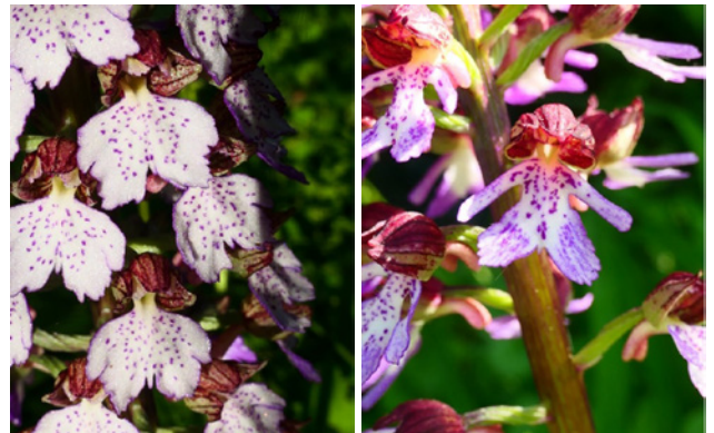
Abb. 6: Nr. 6 (links) blühend und Nr. 15 (rechts) erstmals blühend; 13.04.2024