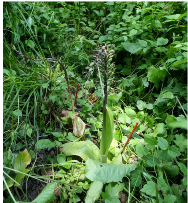
Abb. 23: Fruchtstände von Nr. 3 (rechts, gross mit vielen Früchten) und erstmals erschienenen Nr. 32 (links, kleiner nur eine Frucht), freigeschnitten; 15. Juni 2024