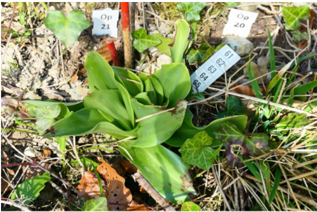
Abb. 15: Rosetten Nr. 20 und 21, äussere Blätter 10 cm lang; 20.03.2025