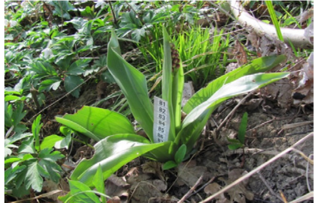
Abb. 12: Nr. 6 mit 8 grossen, breiten Blättern, Nr. 15 mit schmalen Blättern; 04.04.2025