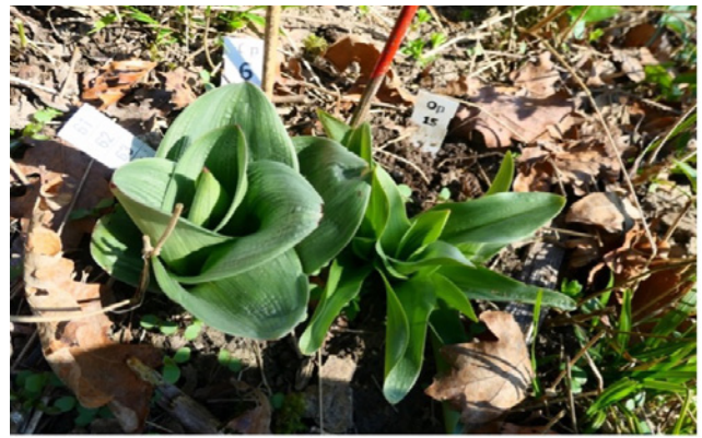
Abb. 4: Rosetten Nr. 2 und Nr. 31 sind dicht beieinander; 20.3.2025