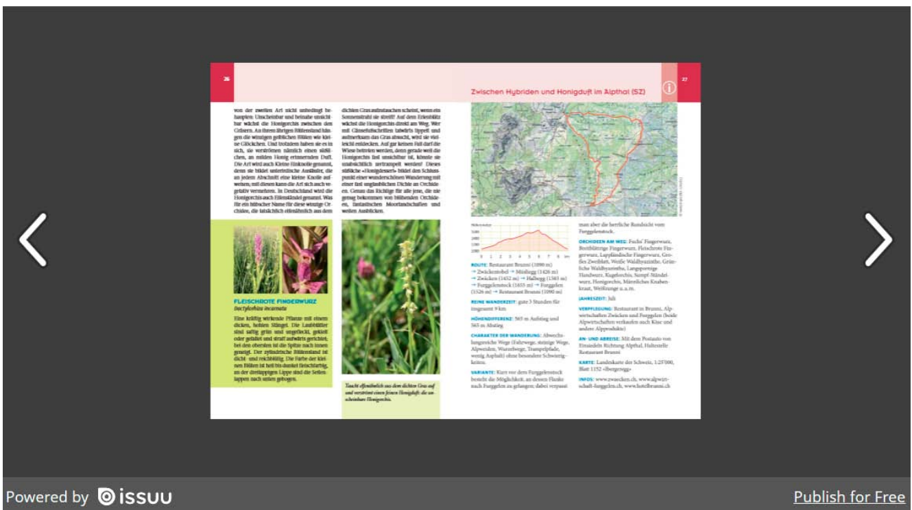
Auszug aus der Leseprobe mit der kurzgefassten, übersichtlichen Routenbeschreibung.

Wer einen Blick in das Buch werfen möchte findet auf der Website des Haupt Verlages eine Leseprobe: https://www.haupt.ch/Verlag/Buecher/Natur/Pflanzen/Orchideenwanderungen.html