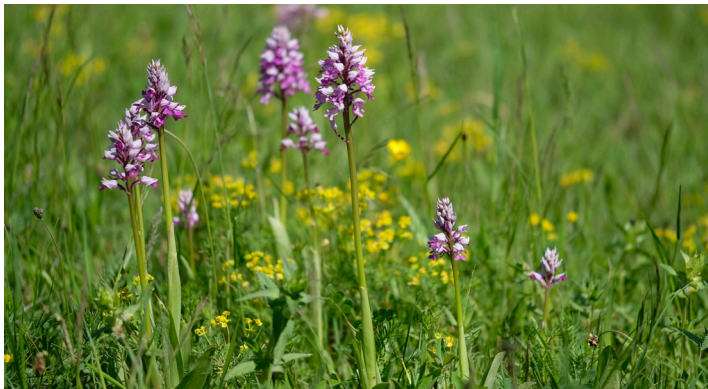
Orchis militaris