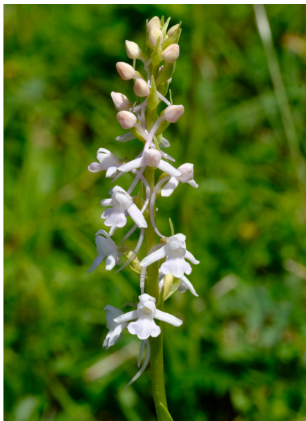
Gymnadenia conopsea forma albiflora , Ophrys insectifera